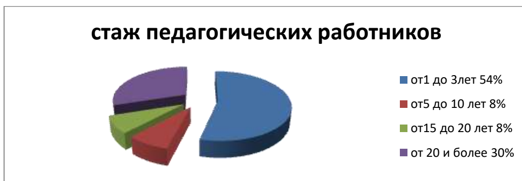
Диаграмма с характеристиками педагогического персонала по стажу работы Детского сада:

от 1 до 3 лет- 7 человек; от 5 до 10 лет- 1 человек; от 15 до 20 лет – 1 человека; от 20 и выше – 4 чел.